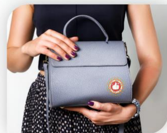
オリジナル品が 手に入る