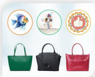
ベースとなる商品と 画像データを用意する

ベースの商品は、導入企業の自社商品または CustoMee が提供する OEM 商品から選ぶことができます。