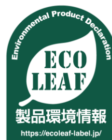
エコリーフマーク