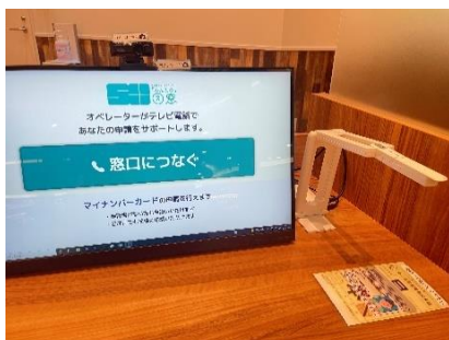
オンライン窓口イメージ