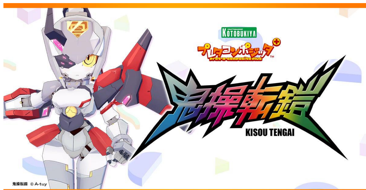
プレタコンポジッタ Plus 鬼操転鎧

アバターモデラー「A-tuy」氏がプレタコンポジッタ Plus 用に作り起こした VRSNS 用の新作アバター。クグツイ、クグツニ、クグツミの3種類のアバターが、プレタコンポジッタ Plus で発売決定！ 2023年9月28日(木) 11時より発売いたします。