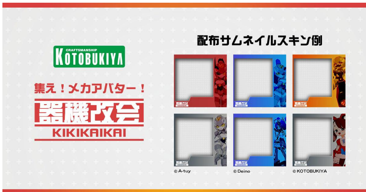
器機改会専用サムネイルスキン

※イベントの詳細やスケジュール、アセット開発用のアバターの取得等については器機改会イベントページをご覧ください。