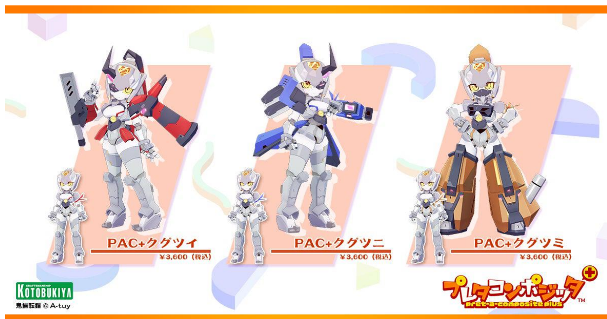
プレテコンポジット Plus 鬼操転鎧 ラインナップ

プレテコンポジット Plus 鬼操転鎧 は、クグツイ、クグツニ、クグツミの3種類がラインナップされます。素体は共通となり、それぞれ武装が異なるほか、顔付も異なります。好みのデザインをお選びください。