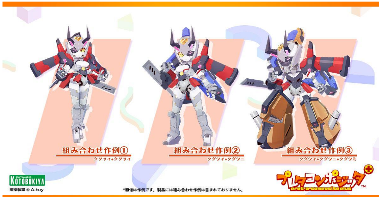
プレテコンポジット Plus 鬼操転鎧 組み合わせ作例

素体にクグツイ、クグツニ、クグツミの武装を組み合わせることで、様々なアレンジをお楽しみいただけます。素体部はプレテコンポジット仕様で作られており、描画負荷に対してゆとりがありますので、安心して様々な3Dモデルやアセットを搭載いただけます。