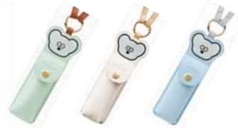
ミントグリーン ホワイト ブルー