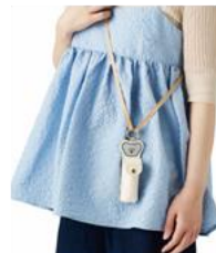
リップホルダー フェイス