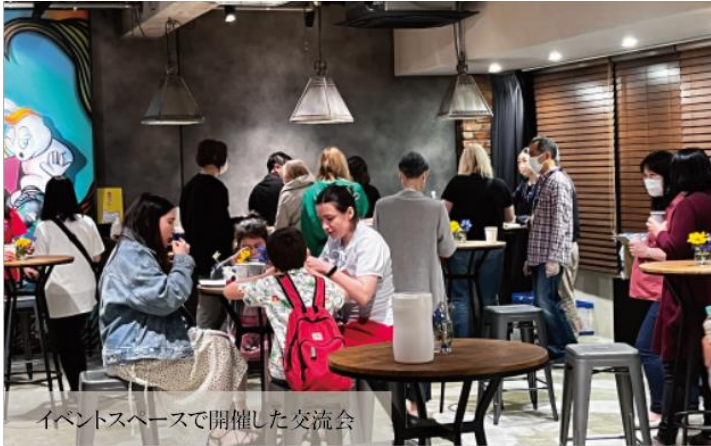
イベントスペースで開催した交流会