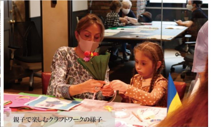
親子で楽しむクラフトワークの様子

当社が運営するアートオフィス A YOTSUYA は、「Brooklyn×Art×Office」をテーマとした 1 棟シェアオフィスで全 22 室各部屋に、世界にたったひとつのミューラルアート(壁画)が描かれています。各階の中央に設けられた広々としたシェアラウンジや共用ルーフバルコニー、約 100 名収容の地下 1 階イベントスペースを備え、開放的でゆったりと交流していただける空間が広がっています。2022 年 5 月には、こちらの開放的なアートオフィスにて、日本 YMCA 同盟運営のウクライナから日本へ避難された皆様をサポートする“ウクライナカフェ HIMAWARI”を開設し、運営をサポートさせていただきました。