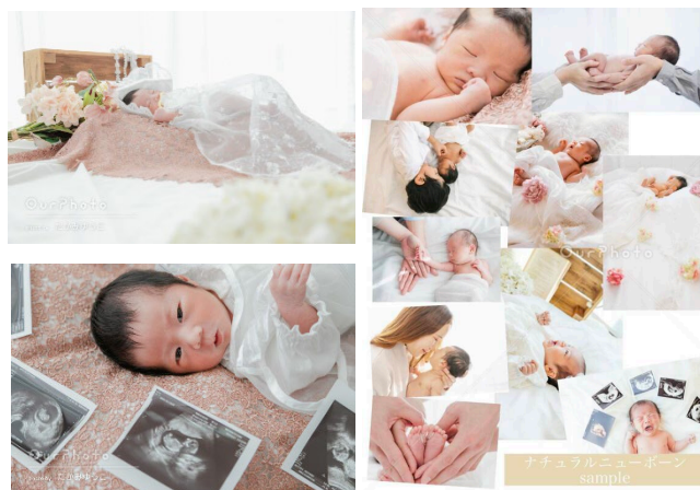
▲ 「ニューボーンフォト」写真の一例

某大手こども写真館にて10年勤務。2018年4月よりフォトグラファーとして本格的に活動を開始。こども写真館時代の経験を活かし、ニューボーンフォトやお宮参り、100日祝い、初節句、ハーフバースデー、七五三など、ご家族の記念を自然な姿で残す写真を数多く撮影している。