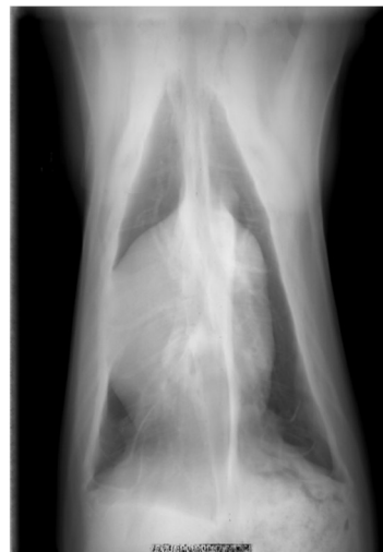
右) AI で骨を除去した画像