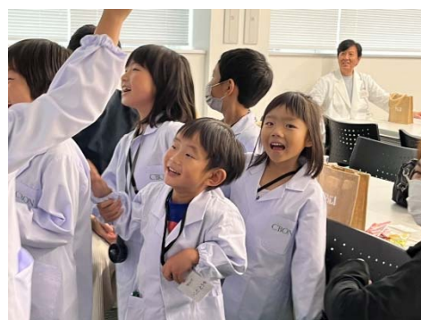
楽しみながら学ぶクイズ大会 笑顔があふれています♪