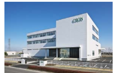
研究開発センター