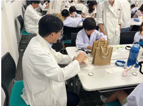
役員もイベントに参加し、子どもたちと交流しました

みんなで白衣を着て化粧品づくり体験。 好きな香りと色を組み合わせせてオリジナルクリームをつくりました。