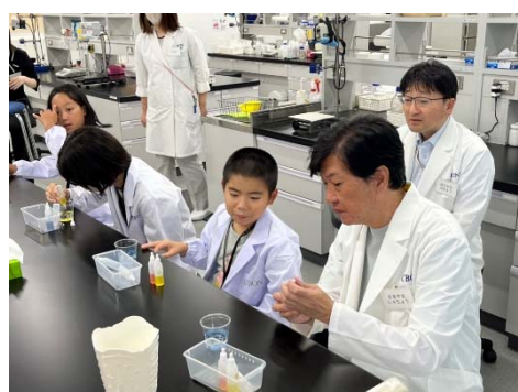
子どもたちと一緒に、社長も実験に参加しました