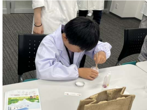
オリジナルクリームを真剣に作っている様子