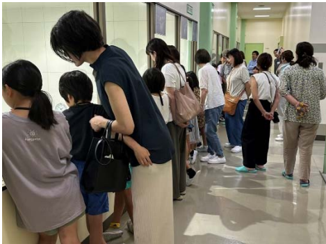
どのように化粧品が作られているか興味津々の子どもたち