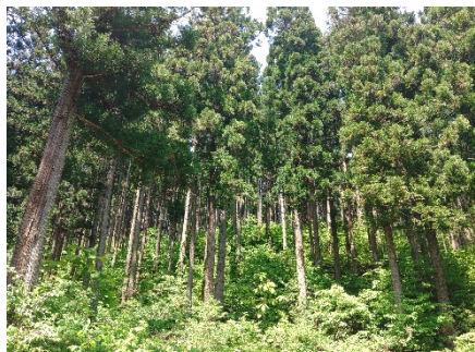
間伐の行き届いたスギ林

本件が連結業績予想に与える影響は軽微です。その波及効果も含めて、長期的な連結業績の向上に貢献していくものと考えております。