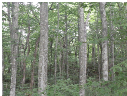
ブナ・ミズナラの混交林