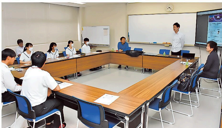
eスポーツの可能性などについて講演 や対談が行われた鼓山塾の特別講座