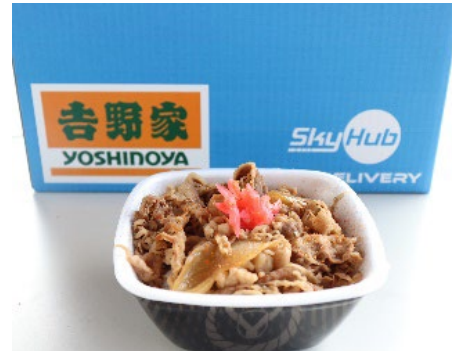
今回ドローン配送した牛丼弁当