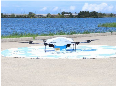
牛丼4個が入った箱を置き配する 物流専用ドローン AirTruck