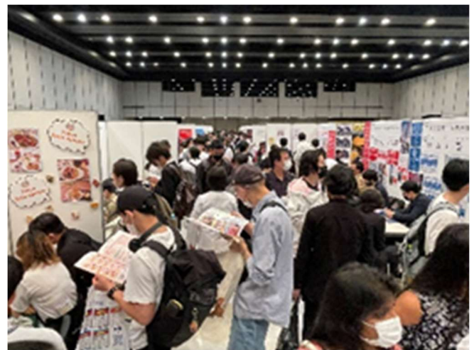
（画像）アクセス日本留学フェア 6月東京会場風景（ヒカリエホール）