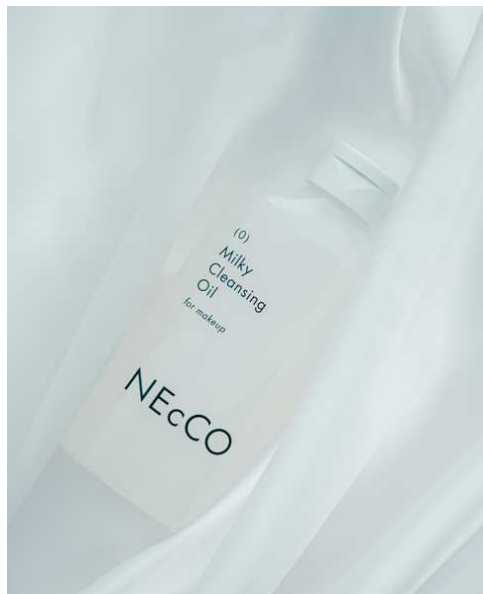
「ネッコ クレンジングミルクオイル」商品イメージ

株式会社ユーグレナ（本社：東京都港区、代表取締役社長：出雲充）は、石垣島産の微細藻類ユーグレナの免疫に関する研究結果に着目して生まれたバイオナチュラル・スキンケアブランド『NEcCO（ネッコ）』より、メイク落とし「ネッコ クレンジングミルクオイル」を2023年9月19日（火）より公式通販サイトであるユーグレナ・オンラインショップ（ https://online.euglena.jp ）にて販売します。今回の新商品追加により、『NEcCO（ネッコ）』の基本スキンケアステップのベーシックアイテムが全て揃い、日々の肌のお手入れを全て『NEcCO（ネッコ）』で完結できるようになりました。