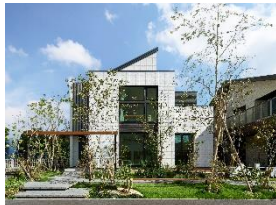
Model house A 「リアルスベックの 単世帯2階建て」

「いま建てるなら、20年後のスタンダードを」 街中でありながら“自然との一体感が感じられる暮らし”を想起させる、 緑豊かなランドスケープの中に、ライフスタイルの異なる3棟のモデルハウスが 建ち並ぶ、新しいカタチの複合型住宅展示場です。 アイ工務店が考える20年後のスタンダードを体現する 様々な生活に合わせた3棟のモデルハウスは、 リアルスベックでご体感いただけるアイ工務店の「見本市」であり「メッセージ」です。 アイ工務店の全てをご体感いただき、ぜひその目でお確かめください。