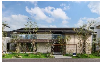
Model house B 「W断熱など テクノロジー体験棟」