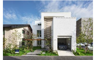
Model house C 「都市型 二世帯3階建て」