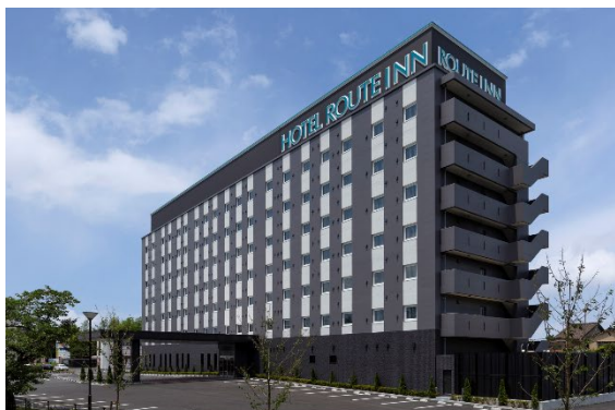
ホテルルートイン 外観イメージ

今後も更なるサービスの機能拡充を行い、ルートインホテルズの顧客満足度ならびに自社予約比率の向上を支援するだけでなく、現地決済サービスである「tripla Pay」の導入に伴う手数料の引き下げにより、収益の最大化にも貢献していきます。