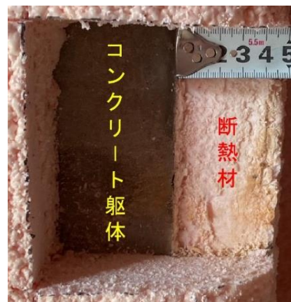
断熱材施工の断面