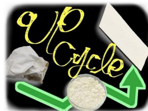
建築廃材のリサイクル建材 「塩ビクロス廃材を利用した建材」

フクビ化学工業株式会社は、以下の3製品において、「2023年度グッドデザイン賞（主催：公益財団法人日本デザイン振興会）」を受賞しました。