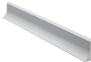
食品工場用巾木 『ソリッドライン』