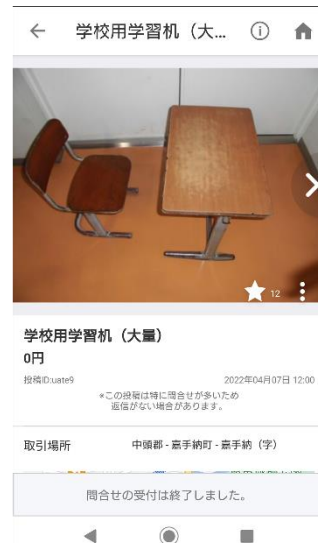
高手納町のアカウントページと出品された機の画像