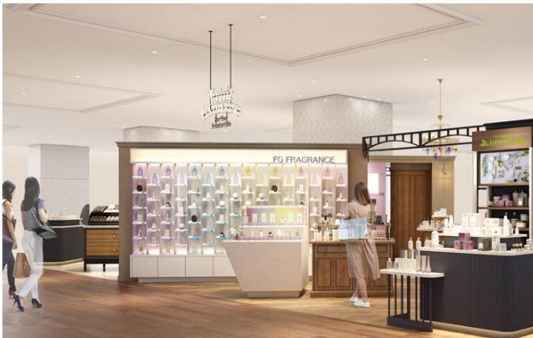
フレグランスエリア イメージパース

今日のあなたはどんな自分になりたいですか？ 新しいフレグランスとの出会いが、新しい自分との出会いに。 ご自身にぴったりの香りがきっと見つかる。