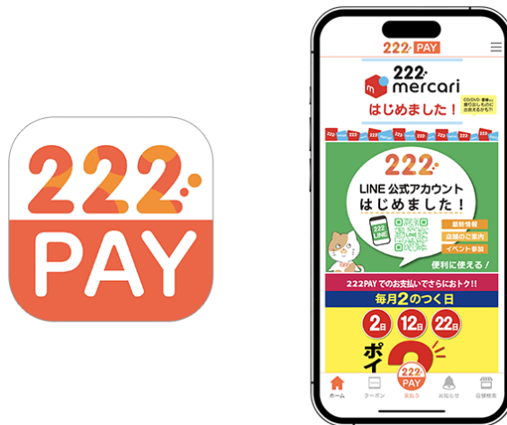
図1 『222 公式アプリ』 アイコン/トップ画面

また、アプリ会員限定クーポンやお得な最新情報が届き、キーワード・GPSによる店舗検索ができるなど、便利な機能を搭載しています。