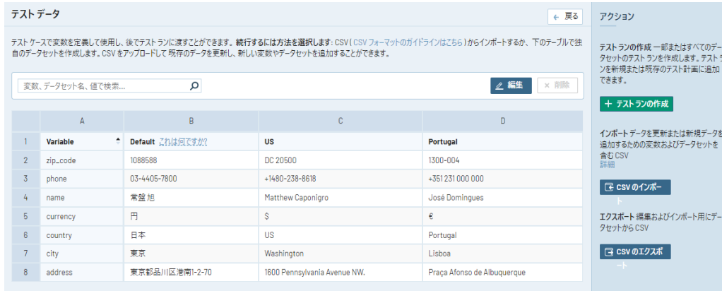
図 1：変数に渡す値をパラメータ化