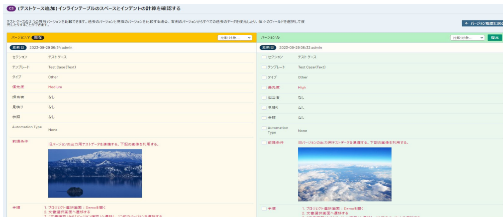
図 3 : テストケースバージョン管理の画面イメージ