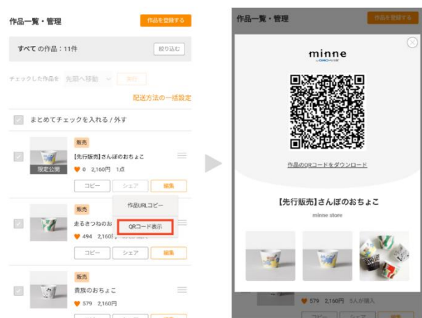
<画像：QRコード発行画面>

このように、『限定公開』を活用することで、作家・ブランドの販売活動を効率化します。また、オフラインとオンラインの販売を組み合わせることで、売上の向上や機会損失を防止できます。