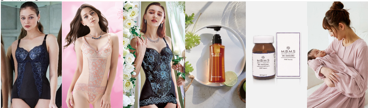
カーヴィシヤス シリーズ