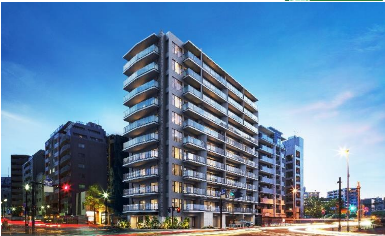
借景外観完成予想図（※2）