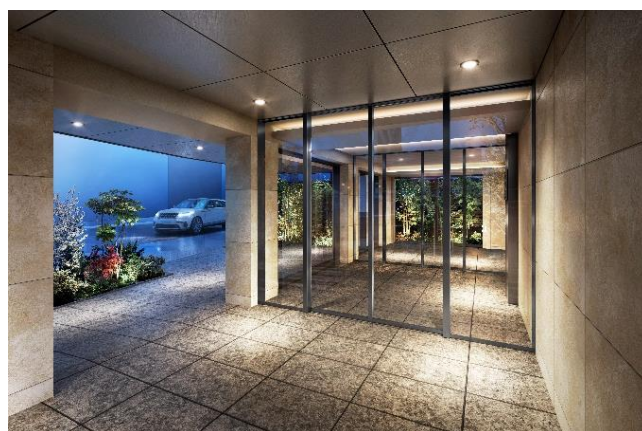
エントランスアプローチ完成予想図 (※2)