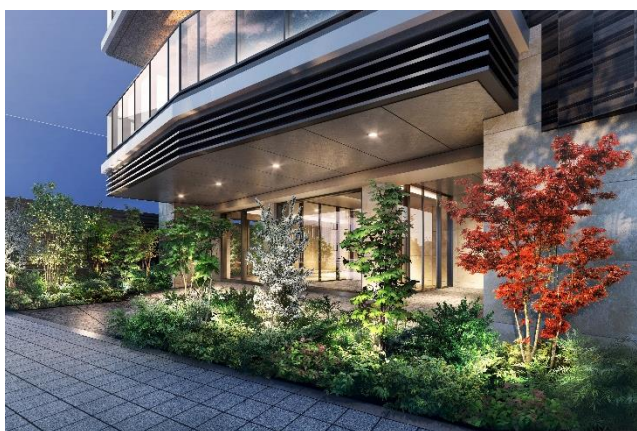
エントランス完成予想図 (※2)