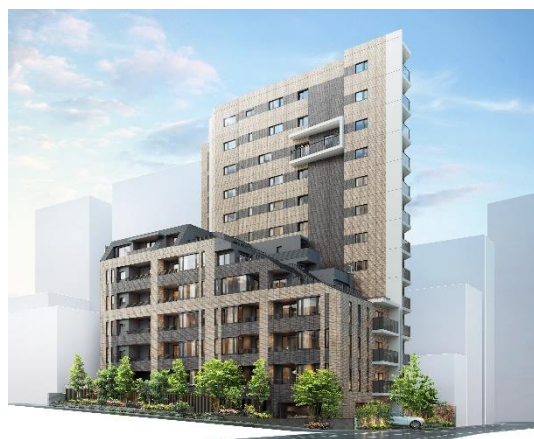
上：エントランスアプローチ完成予想図 下：外観完成予想図（※4）