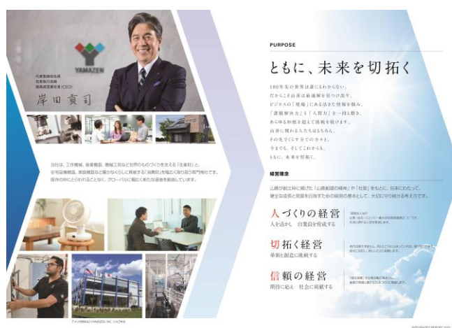
パーパス・経営理念

今後も当社グループへのご理解を深めていただけるよう、開示内容の充実を図るとともに、投資家の皆様をはじめとするステークホルダーの皆様との建設的な対話を行い、さらなる企業価値の向上に努めてまいります。