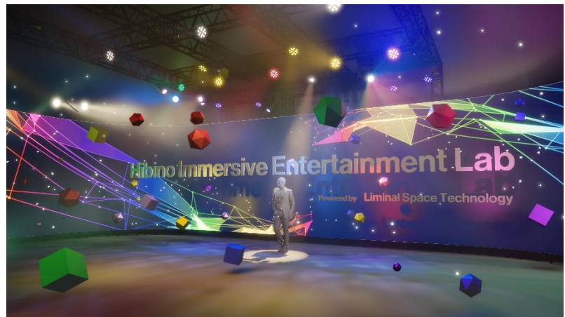
Hibino Immersive Entertainment Lab (イメージ)

ヒビノ株式会社（本社：東京都港区、代表取締役社長：日比野 晃久）は、大型 LED ディスプレイと先端技術の融合による新たな没入型体験を生み出し、エンターテインメント領域へ発信する研究開発の場として「Hibino Immersive Entertainment Lab（ヒビノイマーシブエンターテインメントラボ）」を2023年11月15日よりヒビノ日の出ビル3階（所在地：東京都港区海岸2-7-70）に開設します。