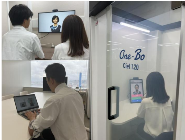
左上: One-Bo Plus の中でKSINを使用 右: One-Bo Ciel の中でKSINを使用 左下: オペレーター