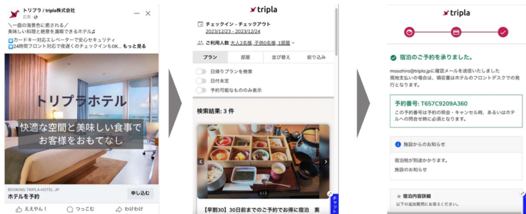
<tripla Boost 広告イメージ>

これにより、これまで人手不足や IT 人材不足などの理由により広告運用に着手できなかった宿泊施設をサポートし、国内外の宿泊者を自社公式サイトへ促すことで、集客費用を OTA（オンライン旅行代理店）手数料の半額以下に抑えて収益最大化を目指します。