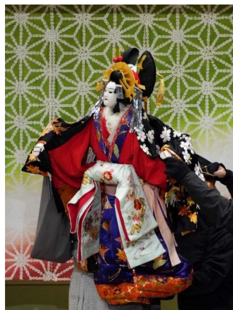
『ひらかな盛衰記』舞台写真

本年10月、歌舞伎や文楽、日本舞踊などを上演し、日本の伝統芸能の拠点として親しまれた国立劇場（東京都千代田区）が建て替えのため閉場しました。本プロジェクトでは、国立劇場が閉場している間も「文楽」などに触れていただく機会を提供し、伝統芸能を未来へ継承していくことに貢献してまいります。