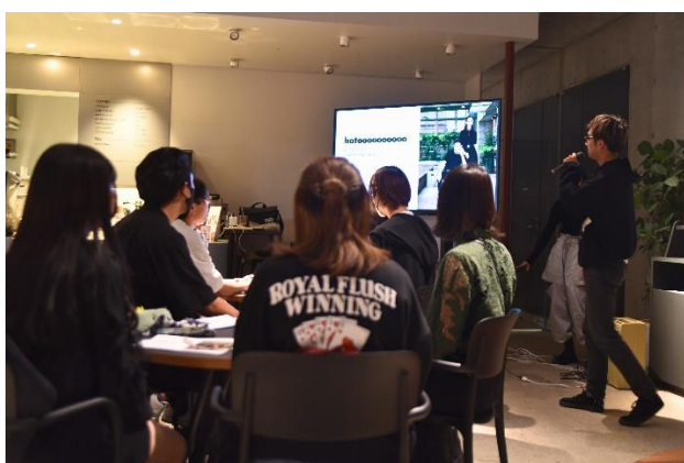
hatoooooo のコンセプトやターゲットなどを説明

2023年10月2日（月）、原宿・神宮前の「HATTO COFFEE」にて、オリエンテーションを開催しました。前半はブランドディレクターより hatoooooo のコンセプトやターゲットなどの説明、テーマ発表、後半は Atlas MAX でのプリント実演が行われました。