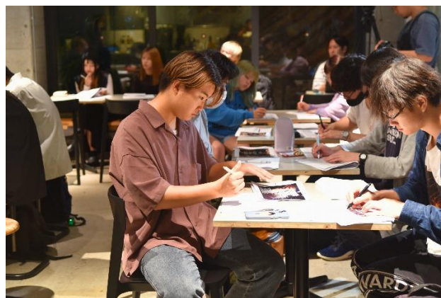
真剣な表情でメモを取る生徒