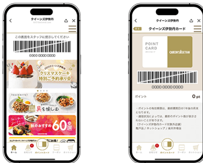
図1 LINE ミニアプリ『クイーンズ伊勢丹』トップ/ポイントカード画面

その他にも、会員限定クーポンやお得な最新情報が届き、アプリから手軽にオンラインショップが利用できるなど、便利な機能を搭載しています。