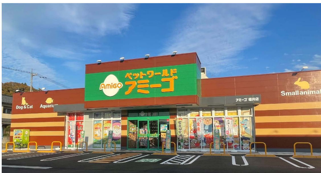
【ペットワールドアミーゴ福井店 外観】

ペットワールドアミーゴ福井店は、株式会社アミーゴ及びアレンザホールディングスグループにおいても福井県初出店の店舗となります。福井市は、福井県北部に位置し、福井県の県庁所在地でもあり、中核市に指定されております。今回の出店は、中部地方のドミナントを推進していくための出店となり、アミーゴでは出店エリアの拡大が、ペットの生活文化の向上という役割を果たし、地域に貢献していくと考え、出店を続けてまいります。なお、今回の出店によりペットワールドアミーゴの出店数は82店舗となります。