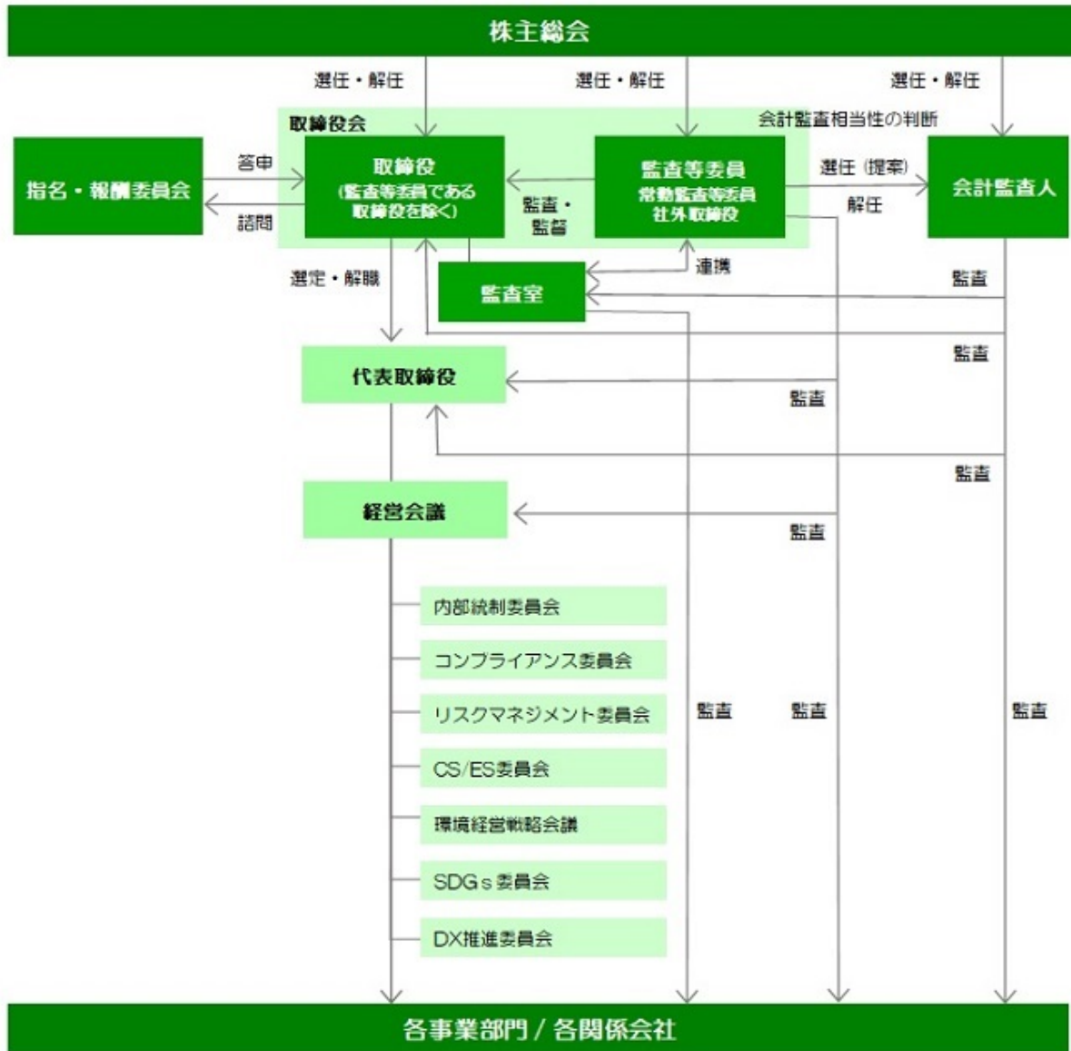
【コーポレート・ガバナンス体系図】