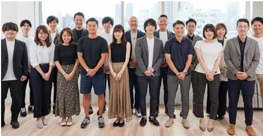
「事業を通じて未来をつなぐ」私たちは自他ともに認める”業界 No.1”を目指します。

(AlbaLink: https://albalink.co.jp/ir-new/ )