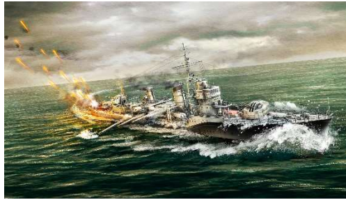
右：イメージイラスト