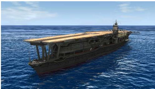
空母「赤城(対ゴジラ兵装)」 左：3D モデルスクリーンショット