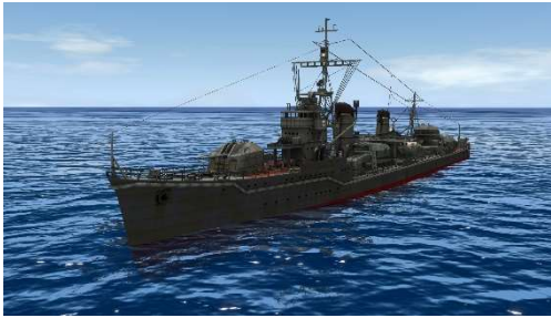
駆逐「雪風(対ゴジラ兵装)」 左：3D モデルスクリーンショット