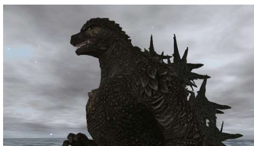
右：ゴジラスクリーンショット