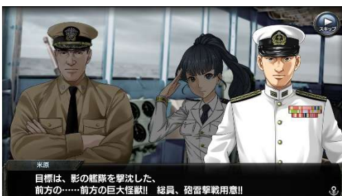
イベント「総力戦」 左：スキットスクリーンショット

また、同コラボ期間中で、所持している全ての艦艇を駆使し、敵の撃破を目指すイベント「総力戦」が開催されます。マップ内に配置されている各ステージの敵に勝利することで、総力戦ポイントが獲得でき、獲得したポイントを使用することで、コラボ限定アイテムをはじめとした様々な商品と交換できます。さらに、本イベントは、蒼焰艦隊がゴジラに挑む模様を描いたオリジナルシナリオ付きとなっています。