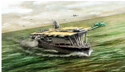
右：イメージイラスト