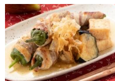
土佐甘とうの豚バラ巻き