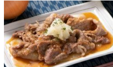
長崎レモンステーキ