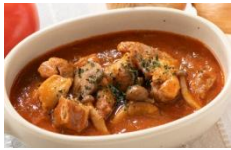
ブルガリア料理 カヴァルマ