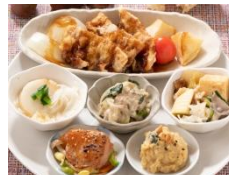
ごま油香る照り焼きチキン とじっくり豚バラ肉の 黒酢和え