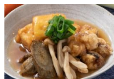
イカ軟骨と豆腐の揚げ出し