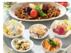
キャベツとシラスのオイル 和え色とりどり野菜の キーマカレー