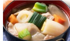
下仁田葱と豚バラの 具沢山豚汁