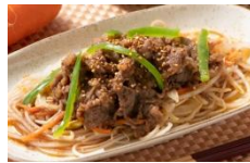
上州牛のプルコギ炒め