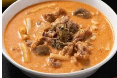
ビーフストロガノフ