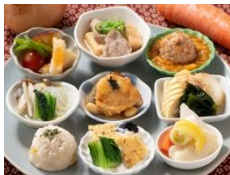
ふっくら厚揚げの牛肉 豆腐と香ばしい甘辛 チキンゴボウ