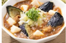
豚バラ肉の こってり麻婆茄子