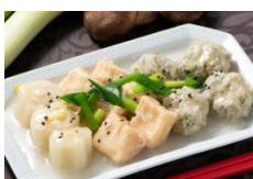
下仁田ネギと肉団子の旨塩煮