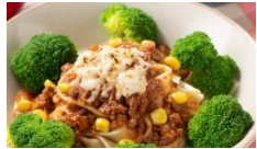
大山ブロッコリーの 饅頭パスタ