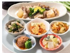
豆腐とピーマンの 牛ハンバーグ 出汁が染みる 具沢山豚こま大根