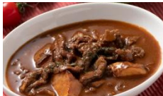
ブルゴーニュ風 牛肉赤ワイン煮