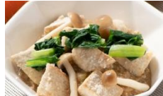
海老芋のXO醤肉あんかけ