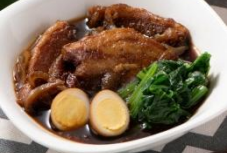
フィリピンの 国民的な味アドボ