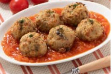
ナポリ風ミートボール