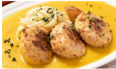
春にんじんの 濃厚ハンバーグ