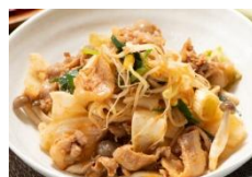
ピリ辛焼きほうとう