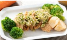
ハーブ香る 若鶏の唐揚げ