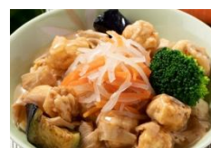
イカ軟骨の天ぷら甘酢餡かけ