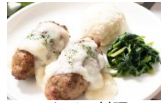
ドイツ料理 ヴァイスブルスト