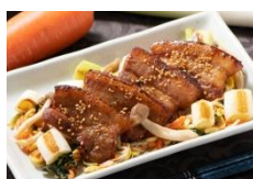
麦えごま豚のオープン焼き