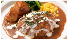
ドミグラスソースの ハンバーグ