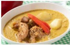
甘口マッサマンカレー