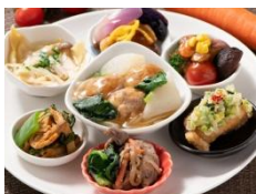
上州牛の焼肉と味が染み 込んだ中華肉団子