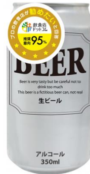
※「飲食店ドットコム認証マーク」と活用イメージ