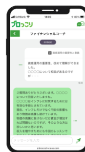
コーチとチャット 回数制限なく コーチ (FP) に 相談できる