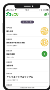
レッスン一覧 受講状況や 次回のレッスン内容 予定が分かる