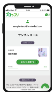
マイページTOP 受講中のレッスンが すぐわかる

今回ご提供するプログラムは軽度な知的障がいがある方の課題・ニーズに合わせて開発した内容となっています。