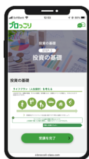
受講画面 動画は全画面 でも閲覧可能