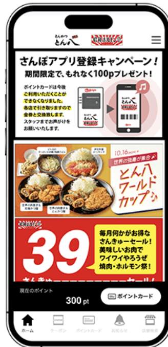
図1 『さんぽアプリ』 アイコン/トップ画面