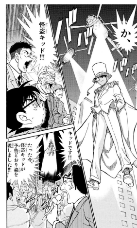
▲「怪盗キッドの驚異空中歩行」コミック場面写

◆期間：2023年12月12日（火）12：00～2024年1月11日（木）23：59