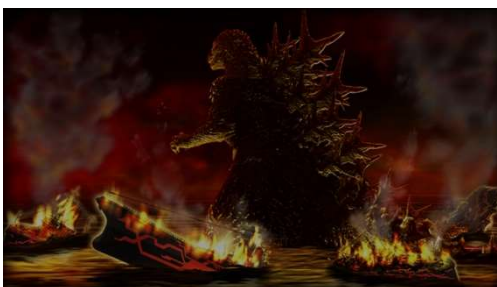
イベント「討伐戦」 左：イベントイメージ

また、同コラボ期間中で、待ち受ける敵の撃破、および特別ミッションの達成を目指すイベント「討伐戦」が開催されます。各ステージのクリアほか、開催期間中に登場している特別ミッションを達成することで、コラボ限定アイテムをはじめとした様々な報酬が獲得できます。さらに、本イベントは、開催中の「総力戦」から続く、蒼焰艦隊がゴジラに挑む模様を描いたオリジナルシナリオ付きとなっています。