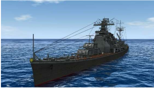
重巡「高雄(対ゴジラ兵装)」 左：3D モデルスクリーンショット