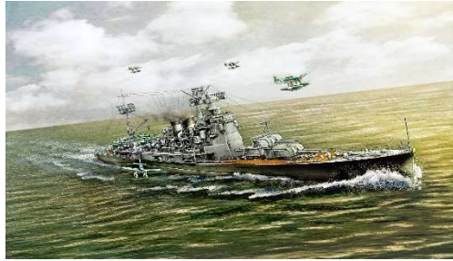
右：イメージイラスト