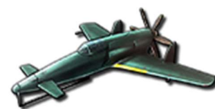
コラボパーツ 「★5 J7W1 震電」

また、コラボ期間中、ログインするだけでコラボパーツ「★5 J7W1 震電」のほか、艦隊強化に役立つアイテムをプレゼントしますので、この期間にぜひログインしてください。