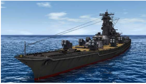
戦艦「大和(対ゴジラ兵装)」 左：3D モデルスクリーンショット