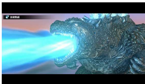
右：ゴジラスクリーンショット