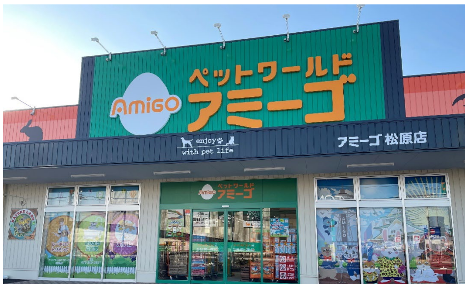
【ペットワールドアミーゴ松原店 外観】