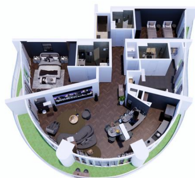
（立体間取図：パース）