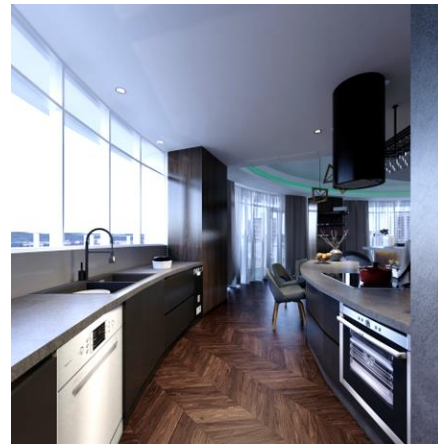
提案時 CG パース画像