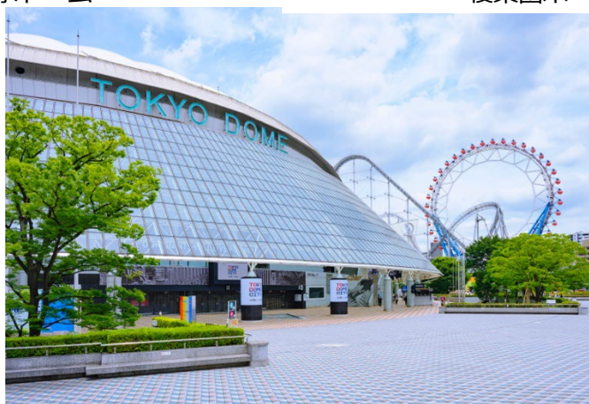
東京ドームシティ