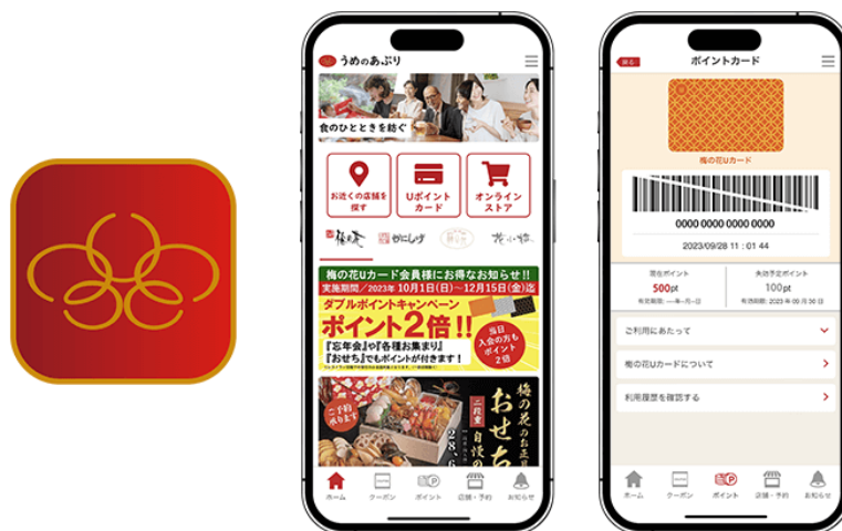
図1 『うめのおぶり』アイコンとトップ/ポイントカード画面

現在、お会計時にポイントを貯めることができる店舗は、『湯葉と豆腐の店 梅の花』『かに料理専門店 かにしげ』『チャイナ 梅の花』『季節釜めし 花小梅』となっており、今後対象店舗を拡大する予定です。