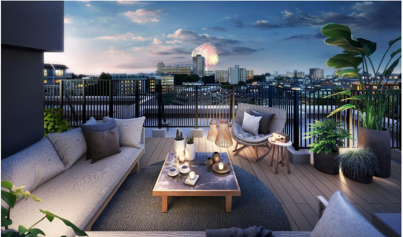
ルーフバルコニー完成予想図 Nタイプ (※9)