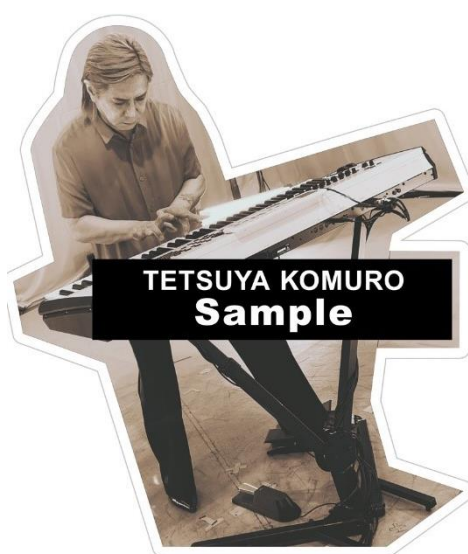
「恋しさと せつなさと 心強さと」