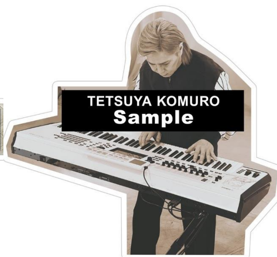
「EZ DO DANCE」

※画像の商品は開発中のものです。また、製造上の都合により実際の商品とは異なる場合がございます。予めご了承ください。