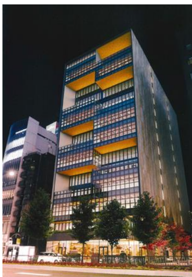
「3rd MINAMI AOYAMA」イメージ図